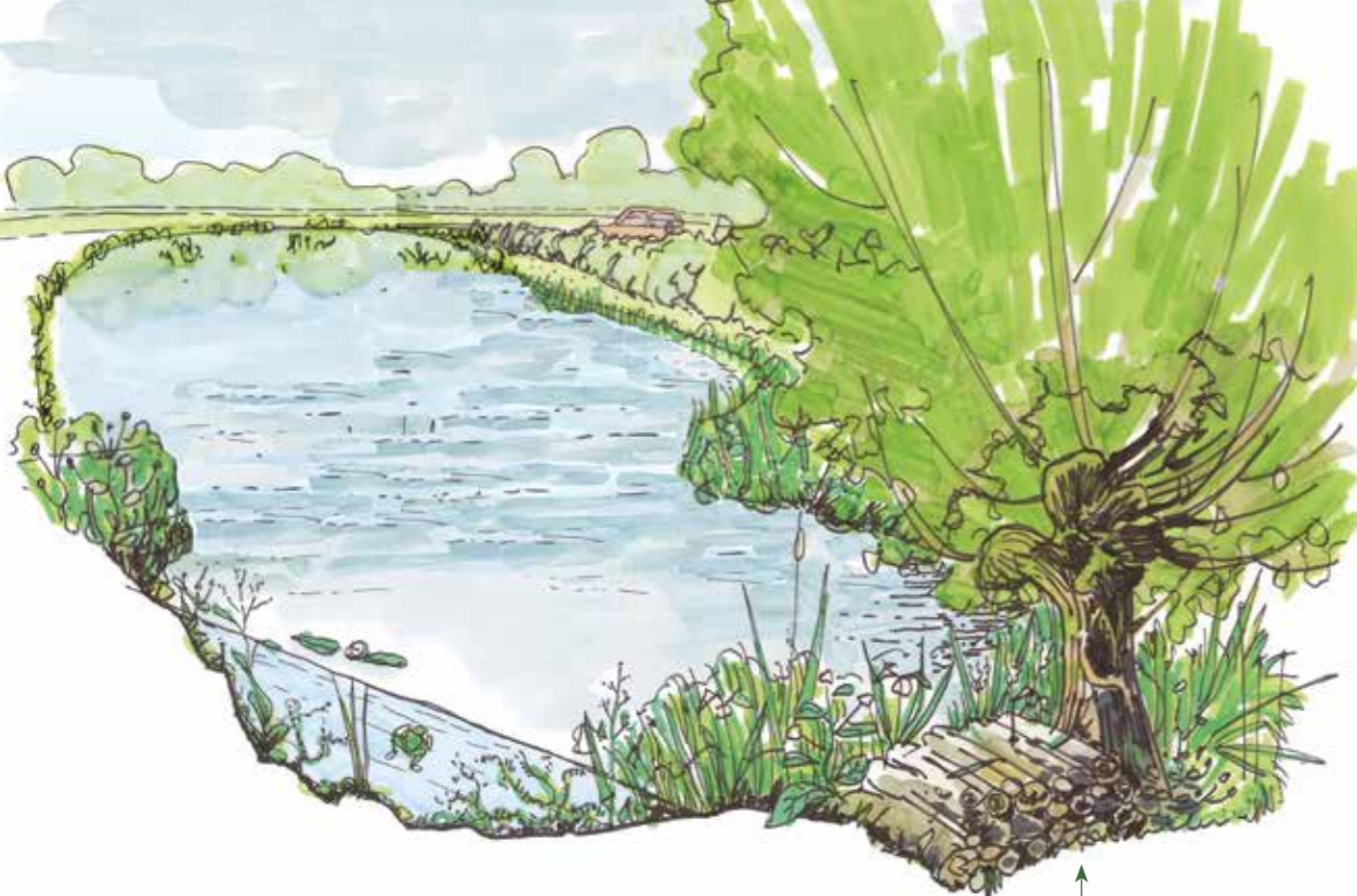
Zone de refuge

Ce document concerne uniquement les zones humides chassées terrestres des départements de l'Eure et de Seine-Maritime