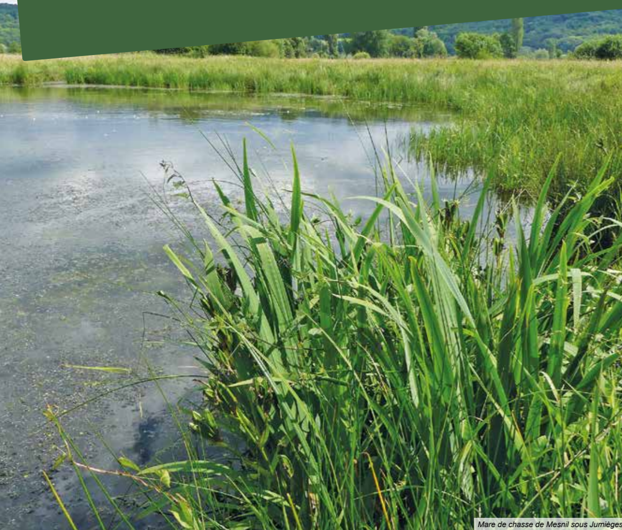
Mare de chasse de Mesnil sous Jumièges