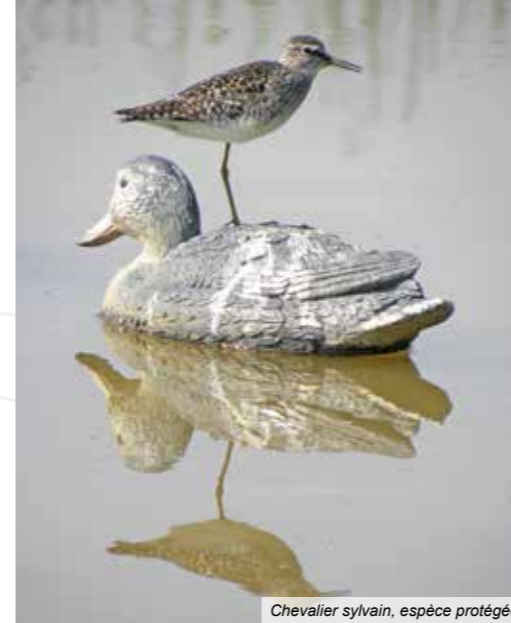
Chevalier sylvain, espèce protégée